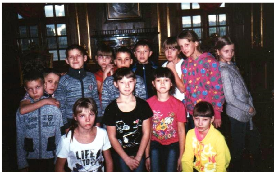
Наша гвардия в одном из дворцов Санкт-Петербурга.